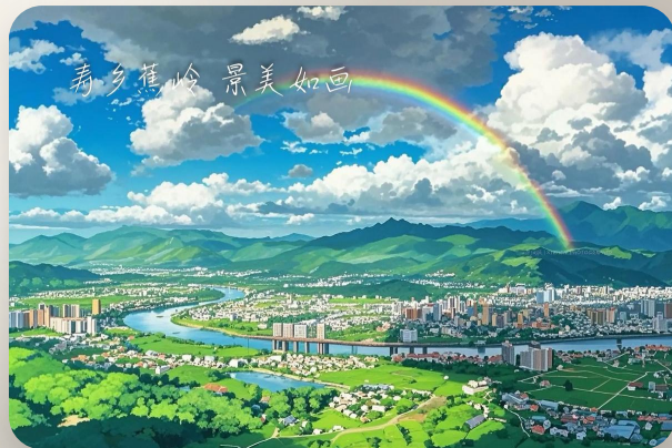
梅州蕉岭长潭自然风光